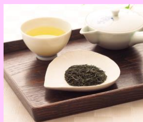
「美味衆合」 移転リニューアル 京都 一保堂茶舗