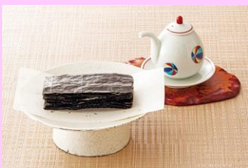
「美味衆合」 移転リニューアル 広島 藝州 三國屋