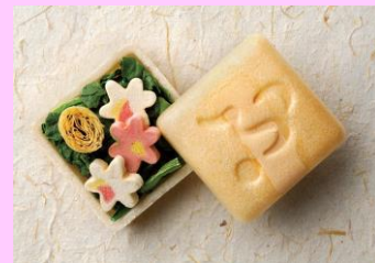
「美味衆合」 新登場 石川 加賀麩 不室屋