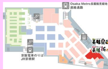
「美味衆合」「美味折々」は移設後、約80㎡に広がります。