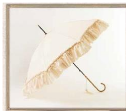
フォックス・アンブレラのフリル長傘