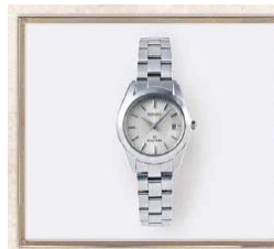
グランドセイコーの腕時計