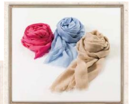
ベグ・コーのカシミアストール