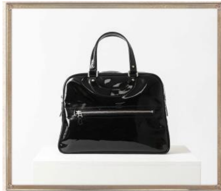
ジャック・ル・コーのリスボン