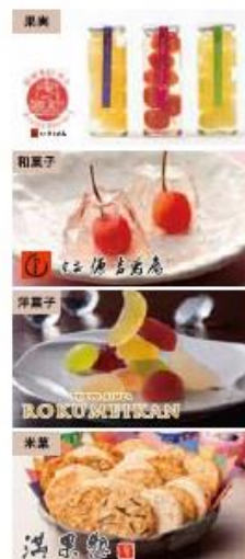
←上から 宇和島・フルーツファクトリー、源吉兆庵、鹿鳴館、満果惣

■1926年ベルギーで創業以来、世界中のショコラ好きを魅了し続ける名門ショコラトリ「ゴディバ」がオープンします。